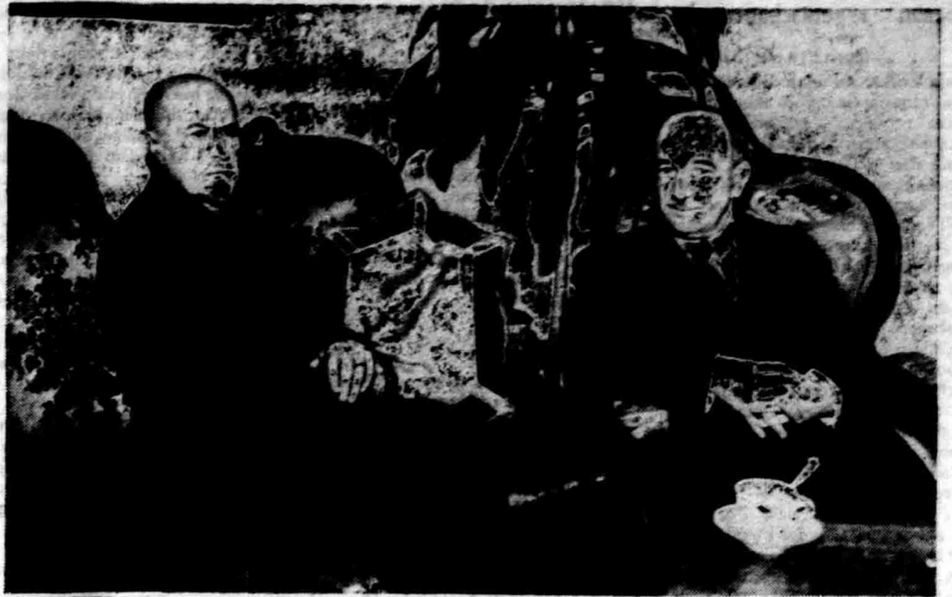
Bekas president Tsjecho Slowakija, Masaryk, jang beloem selang berapa lama memperingati hari tahoenja ke 87, sedang berdoedok-doedok dengan president sekarang, Dr. Benesj.

Di Europa bouwspaarkassen itoe mendjadi dipoeat perhatian teroet-